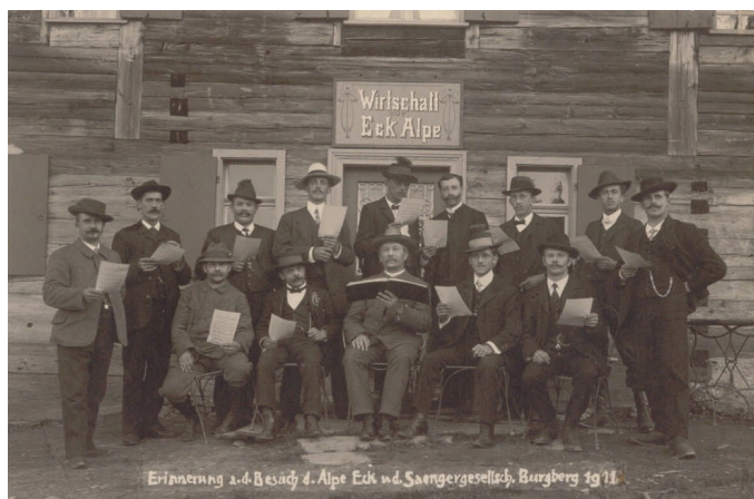
Ausflug zur „Alpe Eck,, im Jahre 1911