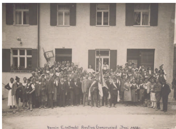
Ausflug nach Gunzesried im Jahre 1922