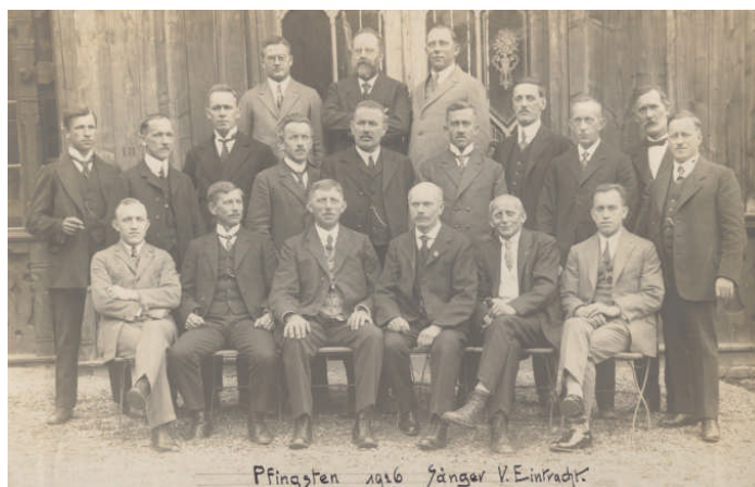
Pfingsten im Jahre 1926